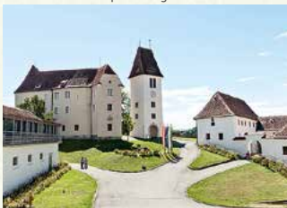
Schloss Seggau

Das Gestüt Piber, die Wiege und Kinderstube der weltberühmten Lipizzanerhengste, ist mit seinen Gestütsführungen und Kutschfahrten, der Schau-Schmiede und dem Kindererlebnis-Weg ein ideales Ausflugsziel für die ganze Familie.